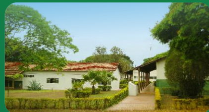
(7) Campus Avançado Campina Verde