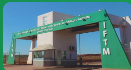
(2) Campus Ituiutaba