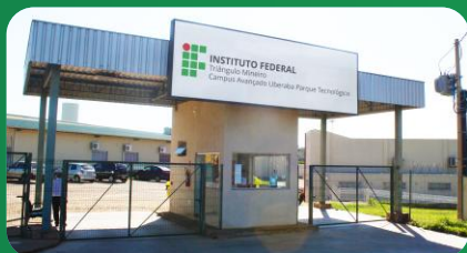
(1) Campus Avançado Uberaba Parque Tecnológico Unidade I