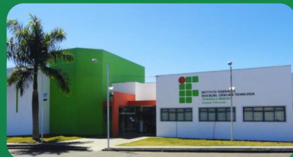
(5) Campus Patrocínio