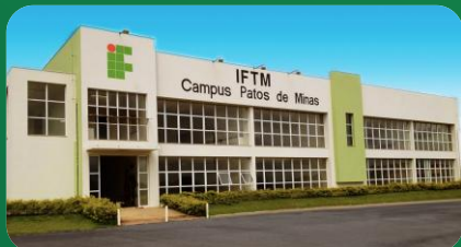
(6) Campus Patos de Minas