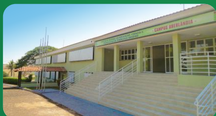
(3) Campus Uberlândia