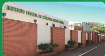
(1) Campus Avançado Uberaba Parque Tecnológico Unidade II