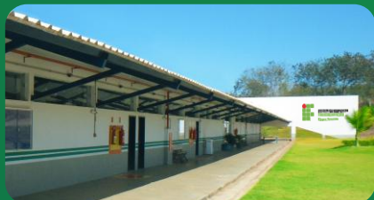
(4) Campus Paracatu