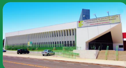
(3) Campus Uberlândia Centro