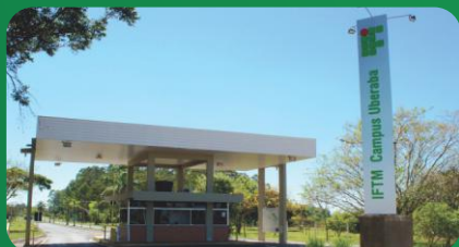
(1) Campus Uberaba